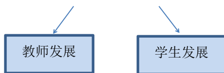
图 1: 课程开发与管理领导小组架构图

3. 课程教学部具体负责学校课程的常规管理与过程管理，及时记录教师上课情况，并对教师进行评价。组织学校课程研讨会，就学校课程内容调整与发展进行必要的、及时的研究与评价。