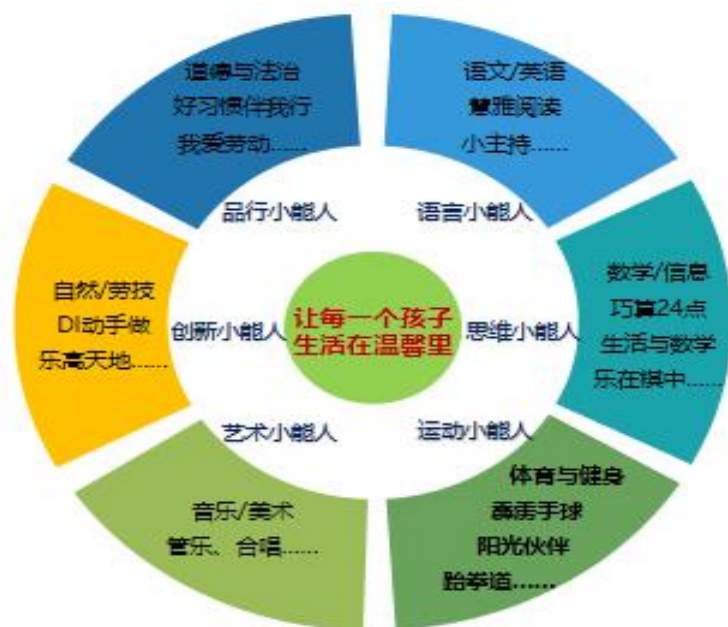
图 1：真新小学“小能人课程”图谱